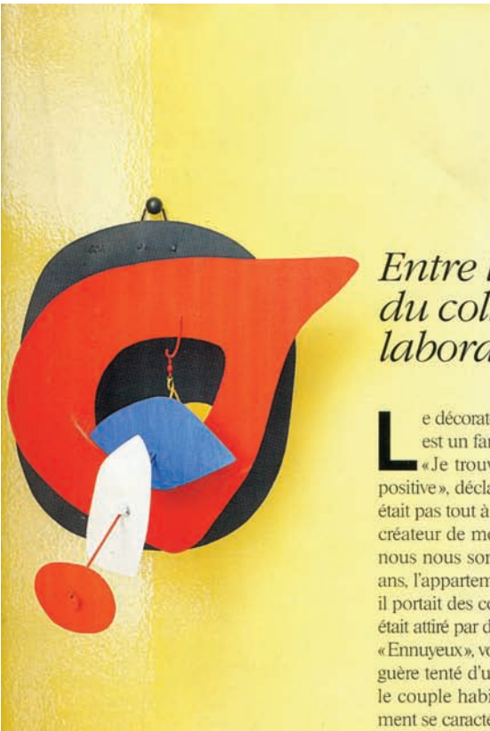
Ci-dessus. Sur l'un des murs du salon, une sculpture en métal qui fait inmanquablement penser au travail d'Alexander Calder.