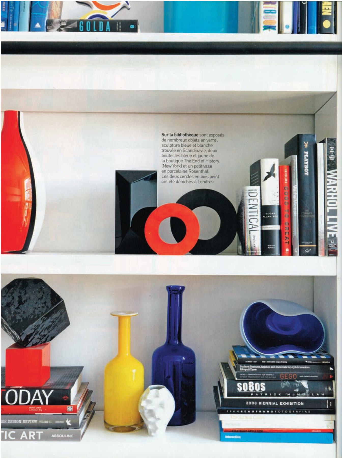
Sur la bibliothèque sont exposés de nombreux objets en verre : sculpture bleue et blanche trouvée en Scandinavie, deux bouteilles bleue et jaune de la boutique The End of History (New York) et un petit vase en porcelaine Rosenthal. Les deux cercles en bois peint ont été dénichés à Londres.